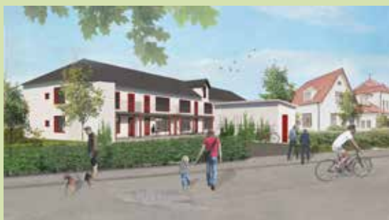
Skissbild: Sydark konstruera