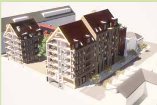
Kvarteret Slaktaren (Ramboll plan och arkitektur)